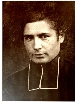
SAINT THÉOPHANE VÉNARD 1829-1861

Jean-Théophane Vénard est né à Saint-Loup-sur-Thouet (79) en 1829. Après le Petit Séminaire à Montmorillon et le Grand Séminaire à